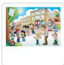
Cahier de vie de L... Enseignant B

6- Une fois le cahier dupliqué, il retrouve le cahier qu'on lui a partagé et un cahier en tout point similaire, nommé « [INTITULE DU CAHIER] – Copie », dont il est cette fois-ci le propriétaire